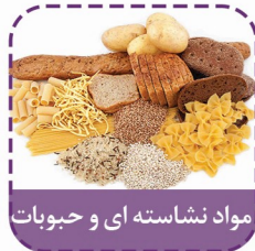
مواد نشاسته ای و حبوبات