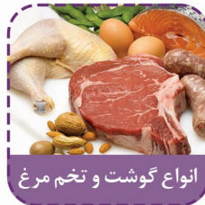
انواع گوشت و تخم مرغ