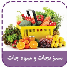
سبزیجات و میوه جات